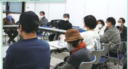
発言者の話 に聞き入る参加 者のみなさん▶