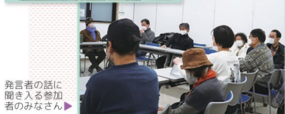
発言者の話 に聞き入る参加 者のみなさん▶